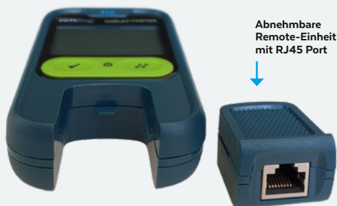
↓ Abnehmbare Remote-Einheit mit RJ45 Port