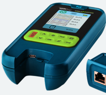
Abnehmbare Remote-Einheit mit RJ45 Port