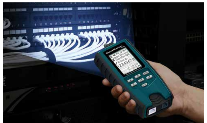
Ein gut ablesbares LCD-Display mit Hintergrundbeleuchtung und großen Symbolen, ein im Dunkeln leuchtendes Tastenfeld und eine integrierte LED-Taschenlampe für das Arbeiten unter schlechten Lichtverhältnissen